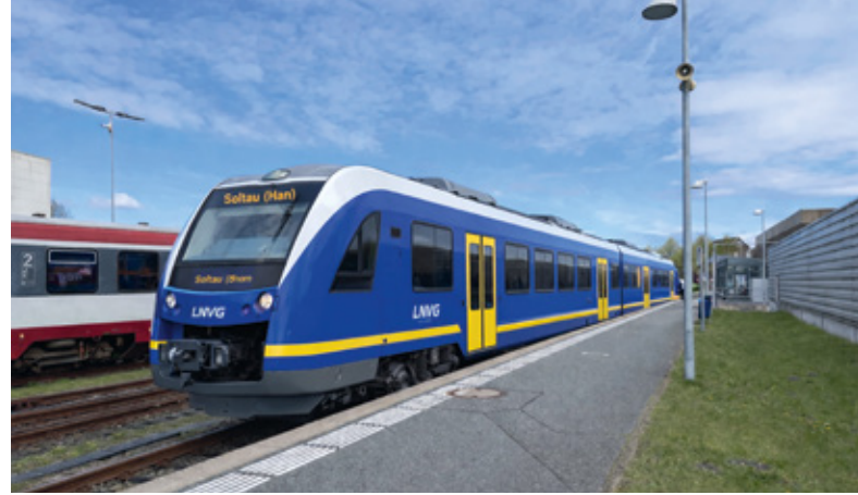
Beispiel eines modernen Bahnsteigs

In Melbeck-Embsen entsteht ein Kreuzungsbahnhof mit 2 Bahnsteigen, der eine Verlegung der planmäßigen Kreuzung aus Amelinghausen ermöglicht. Im Falle von Verspätungen kann so länger auf Anschlusszüge gewartet werden. Der Bahnsteig auf der Seite des ehemaligen Bahnhofsgebäudes (Richtung Melbeck) wird planmäßig von allen Zügen genutzt und erhält neben einer direkten Zuwegung in Richtung Straße eine weitere hinter dem Gebäude. Der Bahnsteig auf der Westseite (Richtung Embsen) erhält einen Zugang in Richtung der Straße zum alten Werk. Im Umfeld sollen Stellplätze für Fahrräder und PKW errichtet werden.