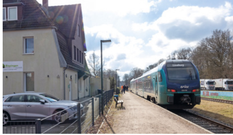
Moderner Triebwagen auf Messfahrt in Bispingen

In Bispingen entsteht ebenfalls ein Kreuzungsbahnhof mit 2 Bahnsteigen. Hier können sich in den Sommermonaten die touristischen Züge des Heideexpress problemlos mit den planmäßigen Zügen der RB 37 begegnen. Die Erschließung des sogenannten Hausbahnsteigs auf der Ostseite erfolgt über den heute für den Museumsverkehr noch vorhandenen Bahnsteig. Beide Bahnsteige erhalten einen nördlichen Zugang in Richtung Bahnhofstraße bzw. Behringer Straße. Der planmäßig genutzte, westliche Bahnsteig erhält zusätzlich noch eine Zuwegung aus Richtung Süden. Die weitere Wegeverbindung wird von der Gemeinde vom Scharler Weg aus über eine Treppenanlage hergestellt. Im Bereich der ehemaligen Ladestraße auf der Westseite des Bahnhofs werden Park+Ride-Parkplätze durch die Gemeinde eingerichtet.