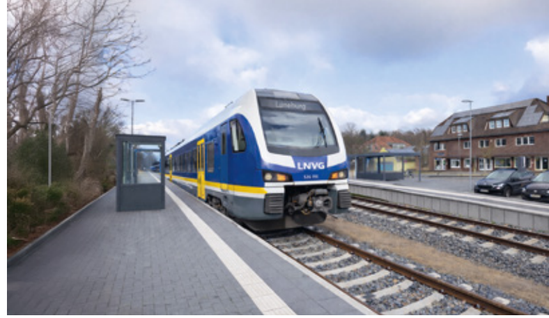
Beispiel eines modernen Bahnsteigs

In Amelinghausen entsteht der planmäßige Kreuzungsbahnhof für die künftige RB 37 auf der Fahrt von Lüneburg nach Soltau. Hier werden sich stündlich die Züge beider Fahrtrichtungen begegnen. Die beiden Bahnsteige entstehen auf Höhe des Busbahnhofs und werden jeweils in beiden Richtungen mit barrierefreien Zuwegungen erschlossen. Auf Seiten des Empfangsgebäudes wird ein Überweg mit Schranken angelegt. Richtung Norden bzw. Wohlenbütteler Straße ist durch die Gemeinde eine Verlängerung des Weges vorgesehen, um auch für Reisende aus diesen Richtungen die Wege möglichst kurz zu halten.