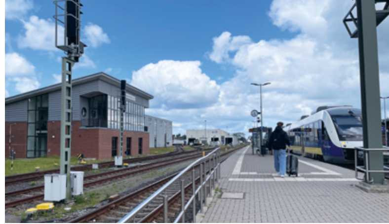
Beispiel eines modernen Bahnsteigs

In Soderstorf entsteht auf dem ehemaligen Ladegleis ein neuer und moderner Bahnsteig mit zwei barrierefreien Zugewegungen in Richtung Ortskern bzw. Bahnhofstraße und in südlicher Richtung an den Bahnübergang Rehrhofer Weg. So ist auch für die Einwohner aus dem Bereich Steinkamp eine schnelle und einfache Erreichbarkeit des Haltepunkts sichergestellt. Auf der heute brachliegenden Fläche der ehemaligen Ladestraße wird parallel durch die Gemeinde eine moderne Park+Ride-Anlage errichtet, die es den Menschen auch aus den weiter entfernt liegenden Ortsteilen ermöglicht, von den neuen Mobilitätsangeboten auf der Schiene zu profitieren.